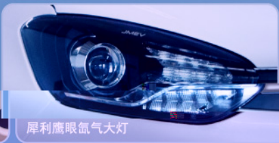
犀利鹰眼氙气大灯